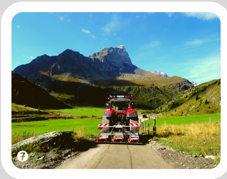
Planie verdichten mit dem dreiteiligen Plattenverdichter