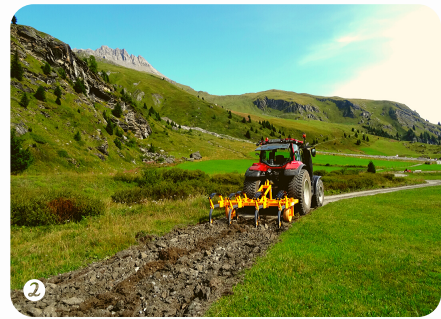
Auf Schlaglochtiefe auflockern