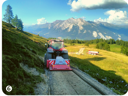
Feinplanie mit Wegpflege Gerät