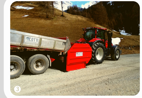
Material ab Wand vorlegen