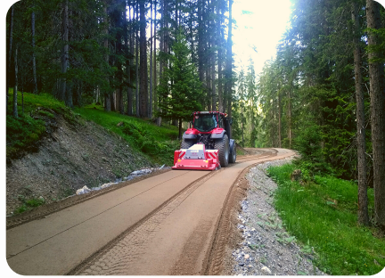
Verschleisschicht instandstellen mit Wegpflege Gerät