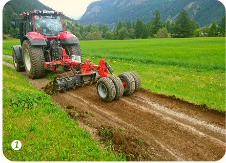
Bankett und Mittelstreifen abschälen