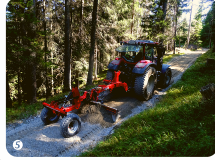
Planie erstellen mittels Planierschild