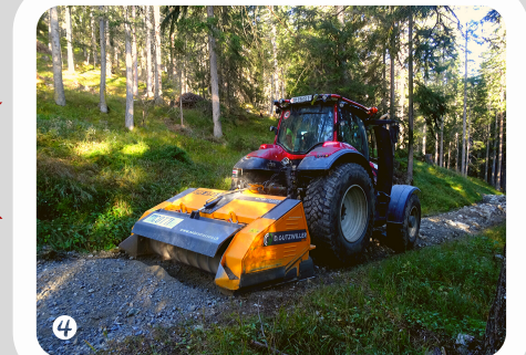
Fräsen mit dem Steinbrecher